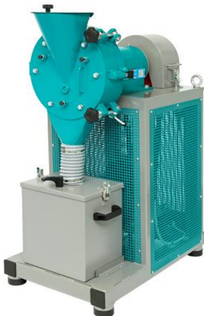
Рис. 1. Истиратель дисковый ИД 200