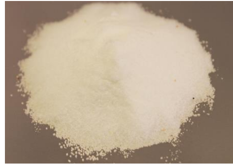
Рис.4. Продукт измельчения