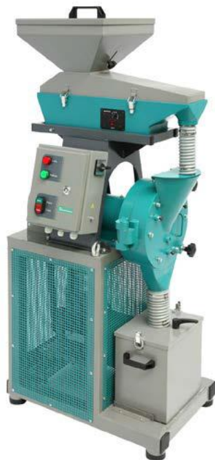
Рис 1. Истиратель дисковый ИД 200 с Питателем ПГ 1