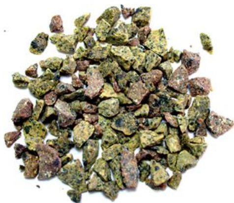
Рис. 3. Материал до дробления