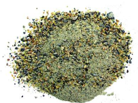
Рис. 4. Продукт дробления