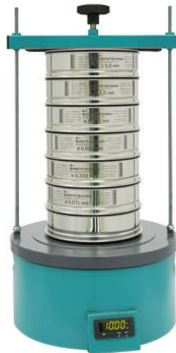
Рис. 1 Вибрационная конусная мельница-дробилка ВКМД 10 Рис. 2 Анализатор А 20