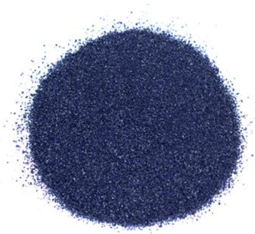
Рис.3. Материал до измельчения