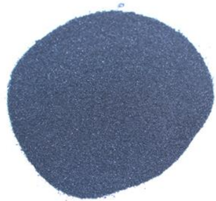
Рис.4. Продукт измельчения