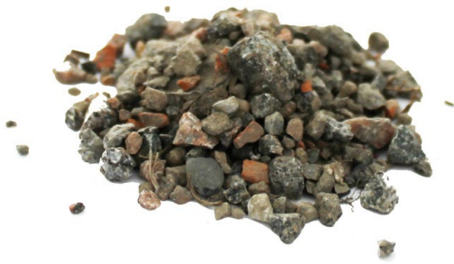
Рис.5. Камни, растительные включения и стекло, исключенные из пробы