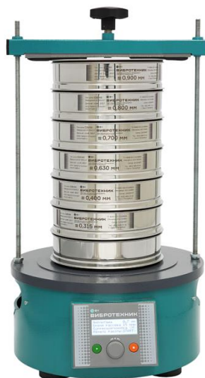
Рис. 2 Анализатор А 20 на базе Вибропривода ВПС