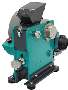
Щековая дробилка ЩД 6М

Комплект предназначен для подготовки проб для физических испытаний и химического анализа в соответствии с отраслевыми стандартами и ГОСТ 10742-71, 11303-75, 16799-79, 23083-78, 5396-77, 20330-91, 52911-2008, 53356-2009, ИСО 15585-2009.