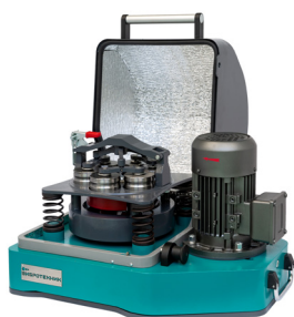
Истиратель вибрационный ИВ 6