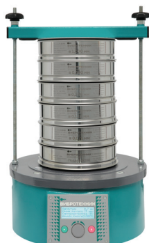
Анализатор А 20 на базе ВПС