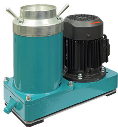
Дробилка конусная ВКМД 10