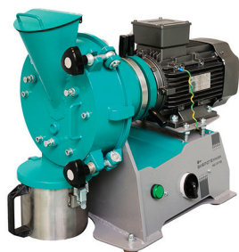
Истиратель дисковый ИД 175М